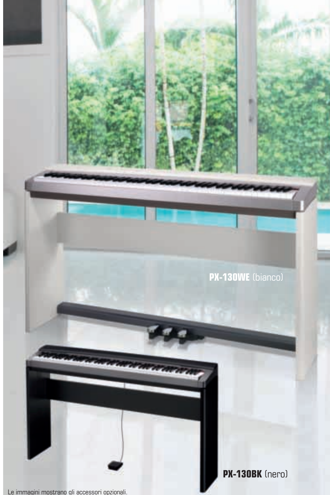
Le immagini mostrano gli accessori opzionali.