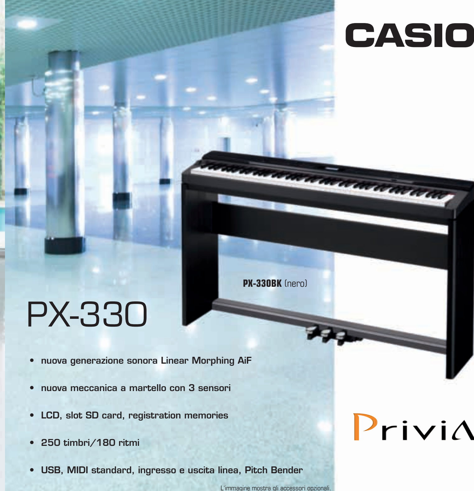
L'immagine mostra gli accessori opzionali.