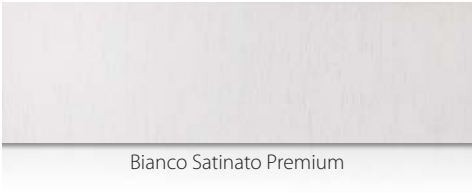
Bianco Satinato Premium

La disponibilità delle varie finiture dipende dall'area di mercato.