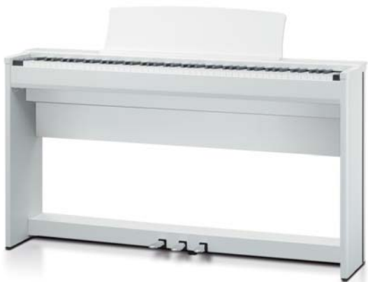
CL36 Bianco Satinato Premium