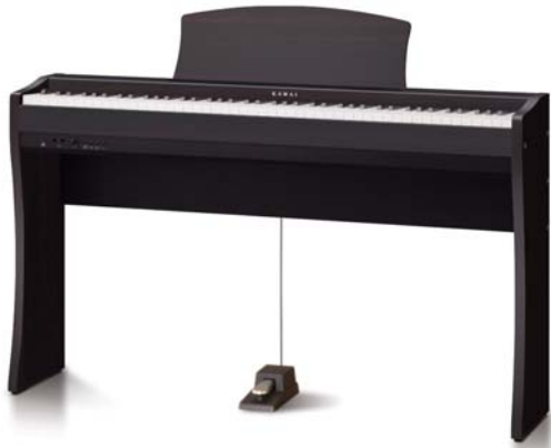
CL26 Palissandro Premium